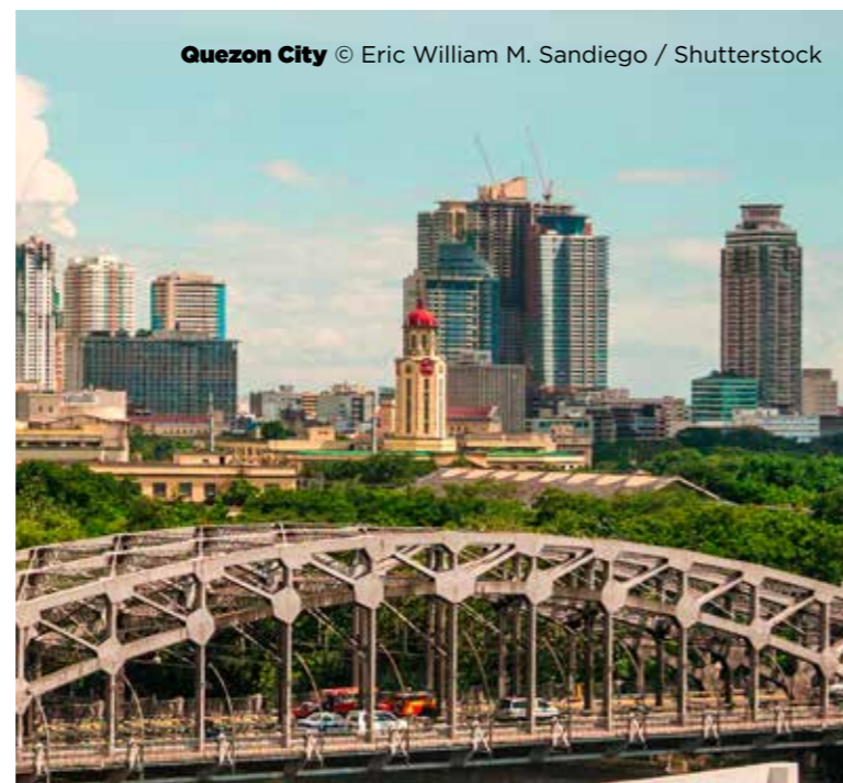
Quezon City

A través del proyecto «Nuestra ciudad 2030», también se celebraron foros de jóvenes. Estos foros ofrecieron a los jóvenes participantes la oportunidad de compartir sus ideas en debates con las principales partes interesadas y los