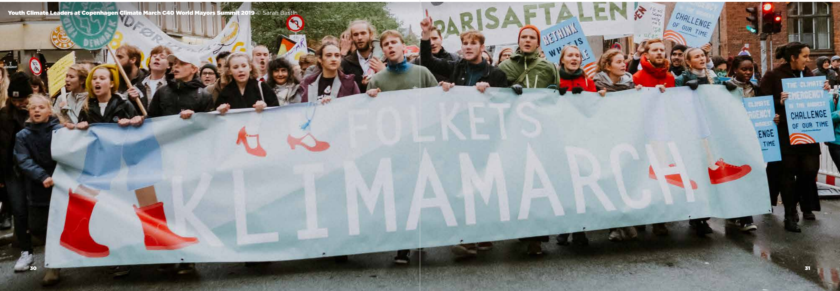
Youth Climate Leaders at Copenhagen Climate March C40 World Mayors Summit 2019

Si los jóvenes de tu ciudad han participado en los procesos de toma de decisiones, podrías considerar la posibilidad de identificar oportunidades nuevas y existentes que se beneficiarían de los aportes de los jóvenes de manera constante. También deberías contactar con tus líderes juveniles y pedirles que te den su opinión sobre cómo va el consejo, qué diferencia creen que está marcando y qué cosas cambiarían.