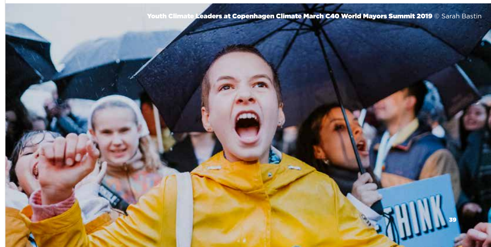
Youth Climate Leaders at Copenhagen Climate March C40 World Mayors Summit 2019

Colaborar con las ciudades y trabajar juntos para presionar a los gobiernos nacionales para que actúen puede tener un impacto bastante positivo y tangible a la hora de afrontar la crisis. Los jóvenes deben recordar siempre que el mensaje que intentan transmitir es importante y que debe hacerse oír en todas partes, y no olvidar que están en el lado correcto de la historia.