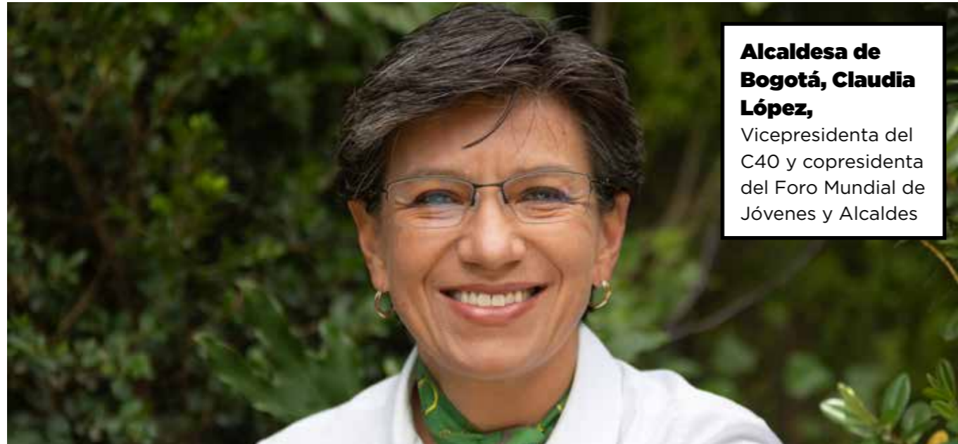
Alcaldesa de Bogotá, Claudia López, Vicepresidenta del C40 y copresidenta del Foro Mundial de Jóvenes y Alcaldes

El objetivo de esta guía es motivar a las ciudades a que presten atención a las peticiones de los jóvenes para que se les incluya de forma más significativa en los procesos de toma de decisiones sobre la política climática. Ofrece consejos prácticos para que las ciudades reconozcan y se comprometan con los jóvenes en cuestiones que afectan a sus vidas, y muestra, a través de estudios de casos, cómo las ciudades están colaborando activamente con los jóvenes para luchar contra el cambio climático.